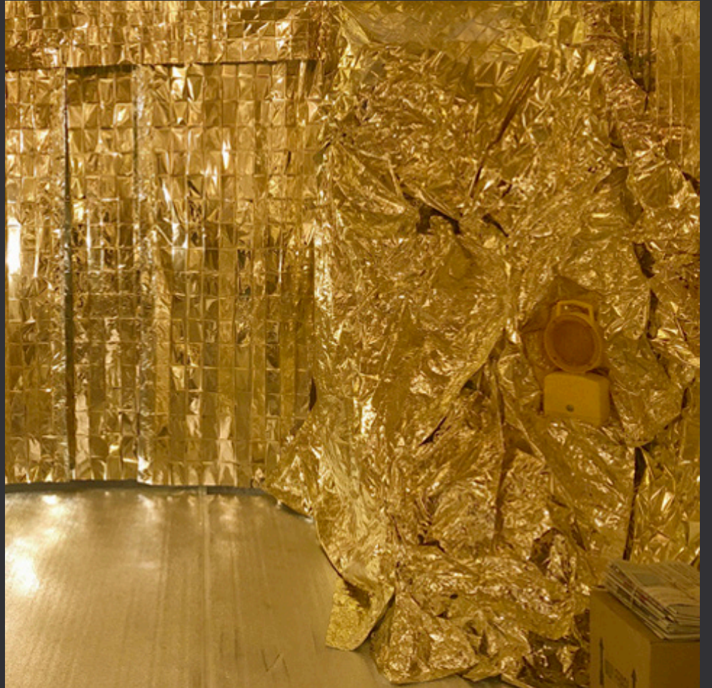
intervenir un espacio con materiales precarios